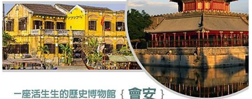
一座活生生的歷史博物館 { 會安 }

像是披上鮮亮黃衣的中國小村子，鄰近還有充滿詩意的秋盤河，閒逛古城與河畔，讓您踏著慵懶的步調感受遠離文明的樂活人生於1999年被世界文教組織認為『世界文化遺產』